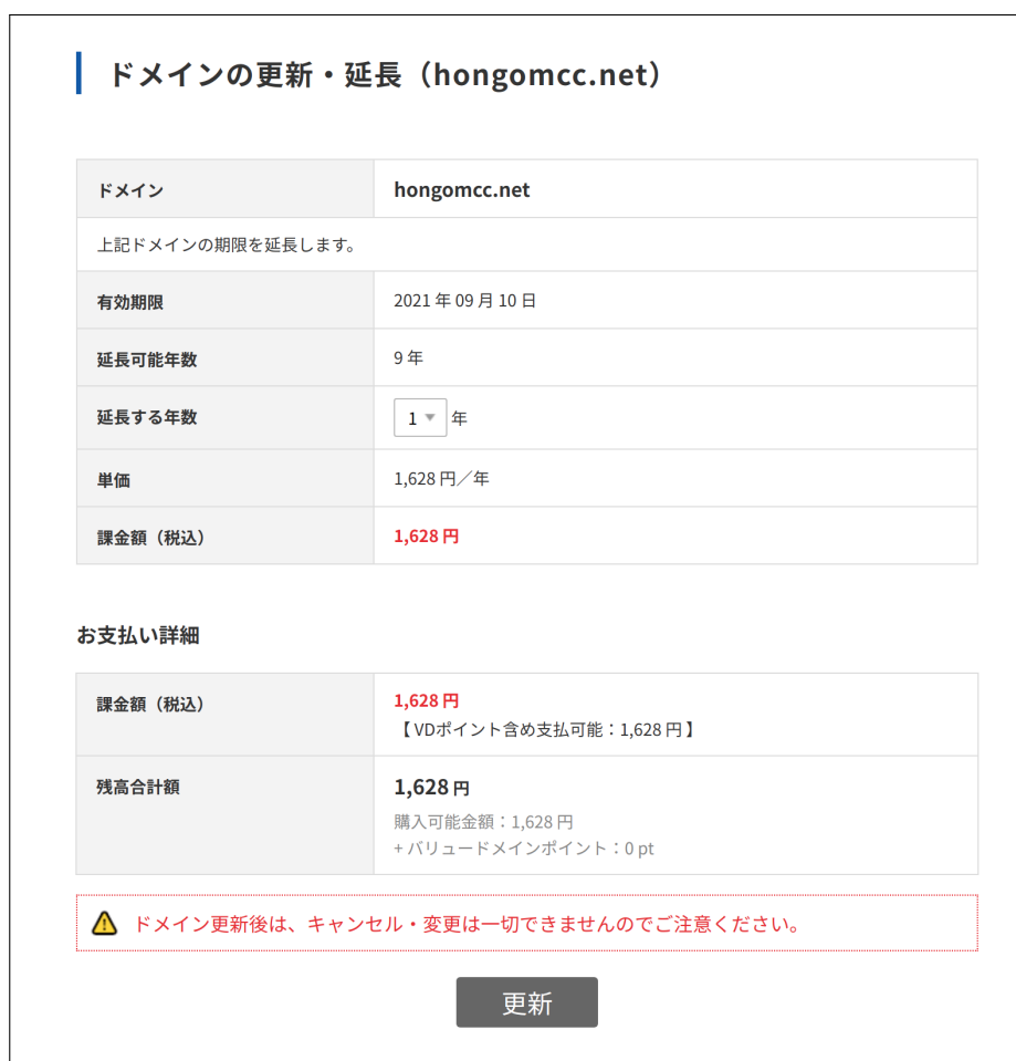
図 12 ドメインの更新

ここでもう一度、ドメインの更新画面へと進もう。図 12 のように「更新」というボタンが押せるようになってはいるはずだ。