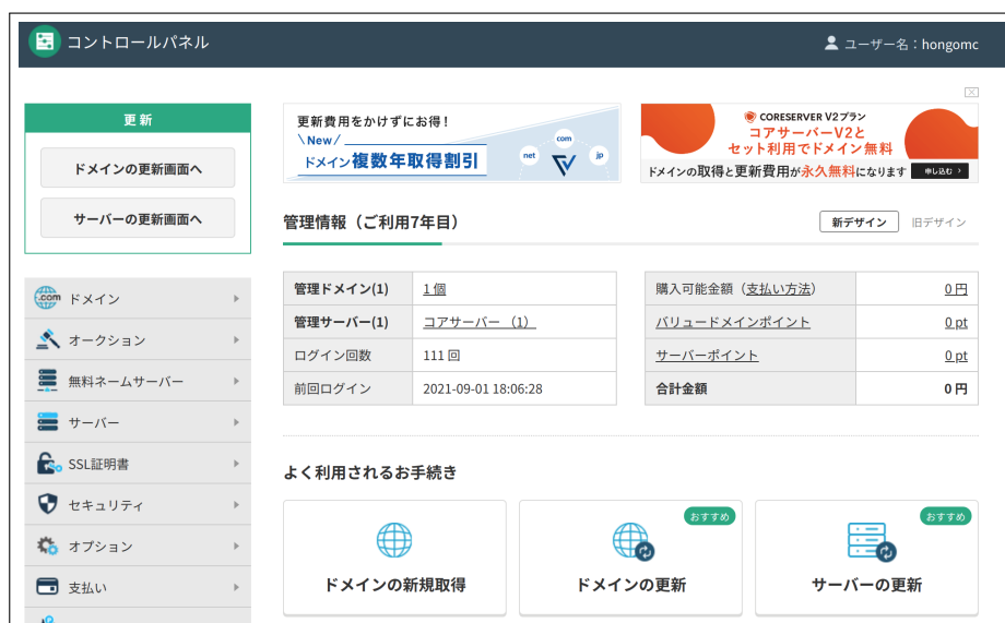
図 2 管理画面

図 1 のように「1.Web サーバ及びドメインに関する諸情報」に記載した Value Domain アカウントを使ってログインする。すると図 2 のような画面が出力されるはずだ [3] 。