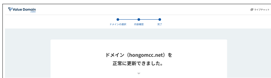
図 13 更新終了